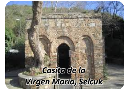
Casita de la Virgen María, Selcuk